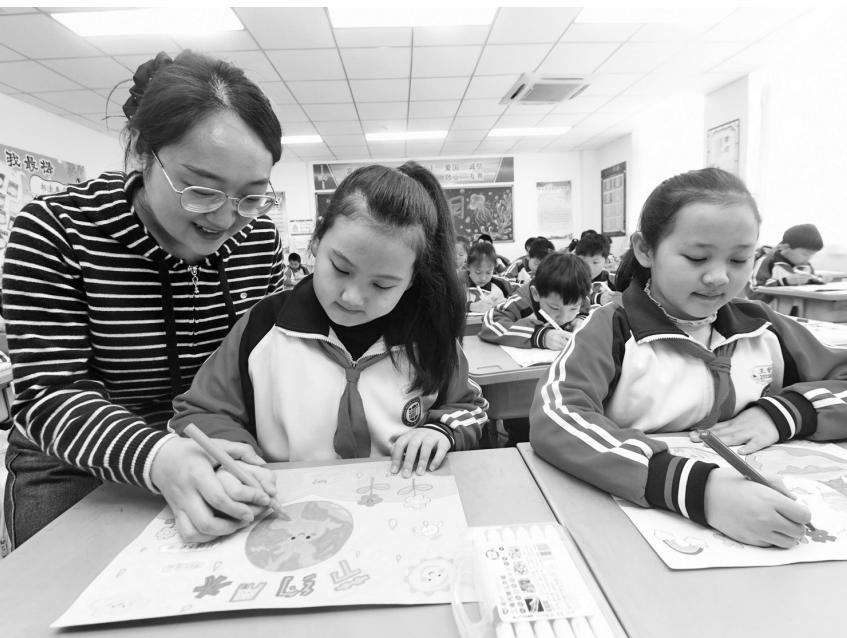
▲在世界水日到来之际,河北省石家庄新乐市各学校举办形式多样的主题活动,帮助学生从小树立爱护环境、节约用水的意识。图为3月20日,新华路小学的学生在老师指导下制作节水宣传画。