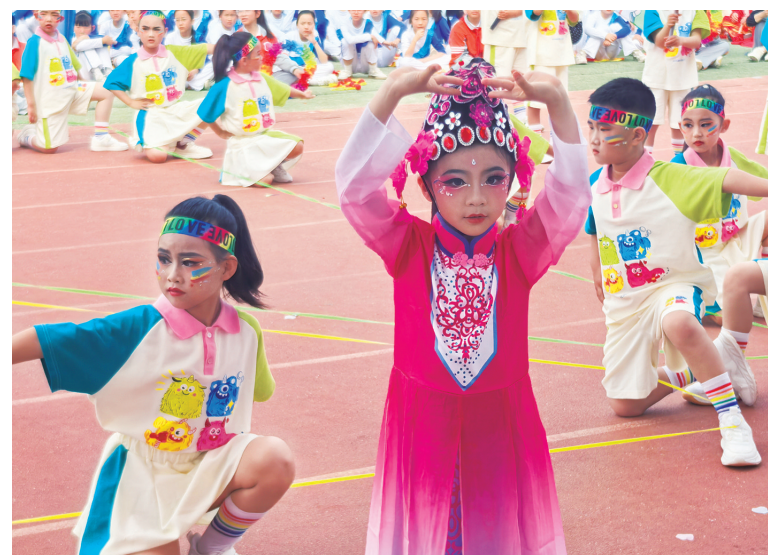
近日,陕西省西咸新区沣西实验学校“以体树人强根基 健体润心向未来”体育节暨第八届田径运动会开幕。这是学校落实“健康第一”教育理念、展示办学成果的重要举措。图为学生在开幕式上进行表演。

自2025活动开展以来,全省已有11.13万名大中小学师生赴延安参加红色教育实践。