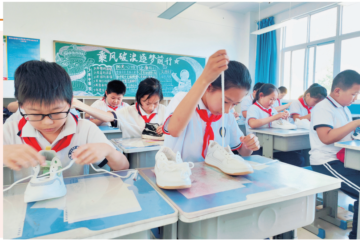
近日,山东省淄博市高青县唐坊学区和店小学举行劳动技能大赛,通过日常生活技能比拼,让学生体验劳动乐趣、培养劳动习惯。图为学生正在进行系鞋带比赛。